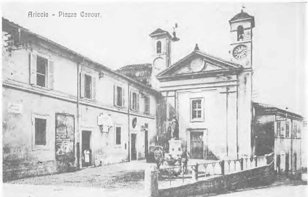
S. Nicola con l'edificio secentesco ancora integro prima della guerra.