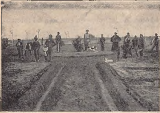
Les petits agriculteurs d'Uribelarra.

ence considérable de chrétiens, mais le fait capital de cette journée est l'imposante procession du T. S. Sacrement. On y voyait quantité de fideles de toute âge et de tout condition; les principaux Cercles de la ville y étaient représentés. Les membres de la Société Catholique , de la Jeunesse Catholique , du Cercle des Ouvriers etc., etc. , faisaient partie du cortège.