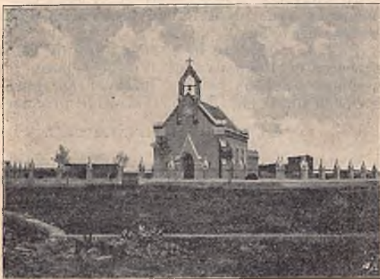
L'église de la Colonie agricole.

PÉROU. — La Maison salésienne de Lima est une source de vie chrétienne pour de nombreux enfants. Les internes, au nombre de 65, sont répartis entre les ateliers suivants: tailleurs, cordonniers, menuisiers, serruriers, ébénistes; une Colonie agricole naissante en occupe aussi un certain nombre. Tout récemment une fanfare de trente-quatre exécutants a pu être formée.