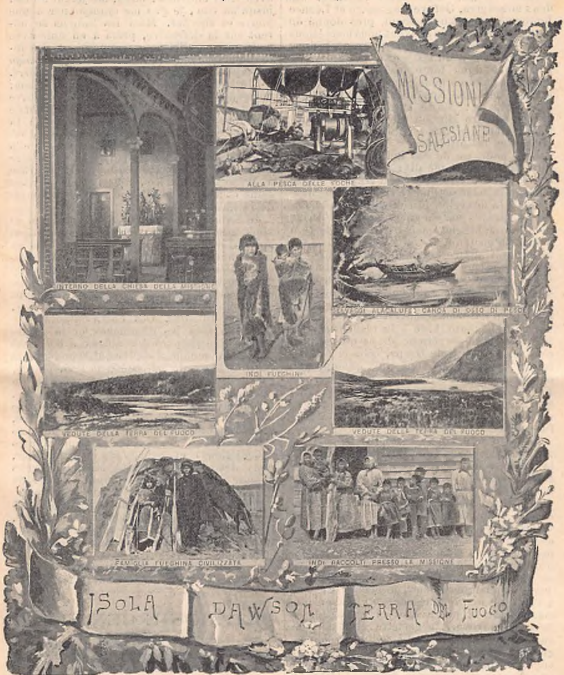
Intérieur de l'église Vue de la terre de Feu Une famille fuégienne civilisée