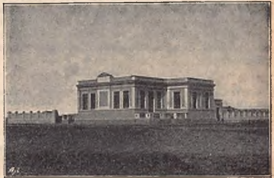
Corps de bâtiment principal.