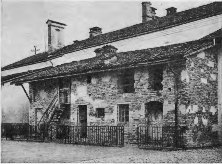
Casetta Nativa di S. Giovanni Bosco