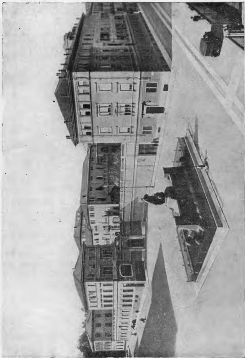
Casa di Torino, dove madre Eulalia morì