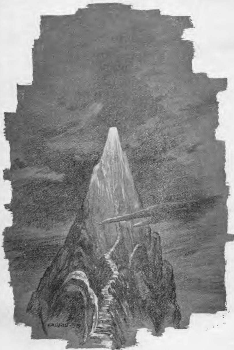
Verso il Cielo!