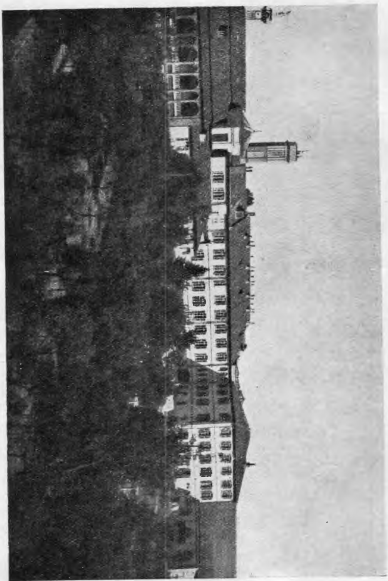
Panorama della Casa di Nizza Monferrato