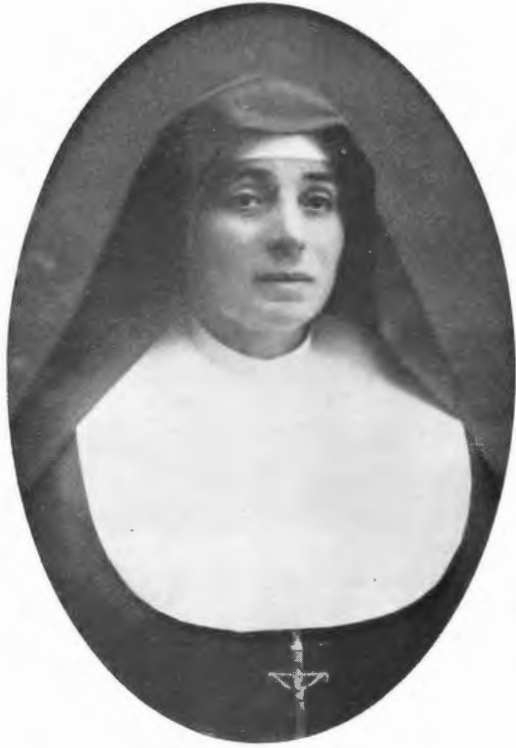
MADRE EULALIA BOSCO