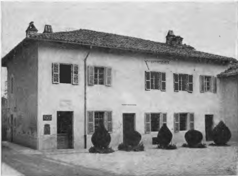
Casa di Giuseppe Bosco, dove nacque Madre Eulalia